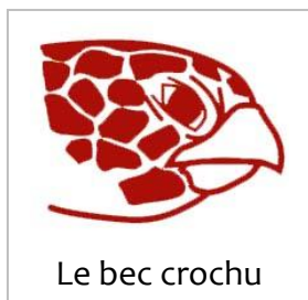
Le bec crochu

Sur son front, on observe une croix formée par les quatre écailles qui se trouvent entre ses yeux. Elle se nourrit d'éponges, qui sont de minuscules animaux marins qui filtrent l'eau pour se nourrir et grandir.